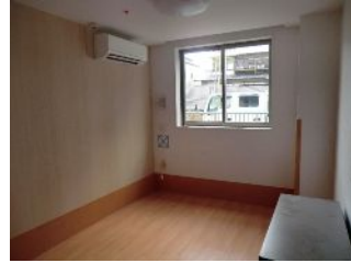
※まだ工事中のお部屋です